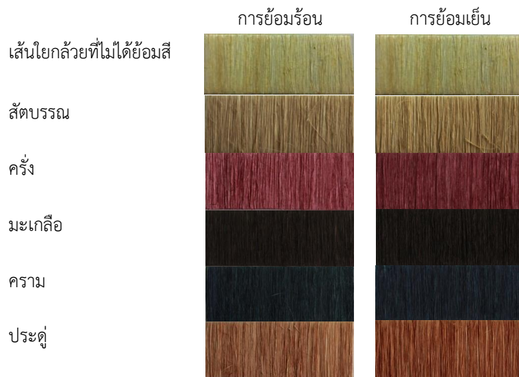
ภาพที่ 2 เส้นใยกล้วยหอมทองย้อมสีธรรมชาติ

3. ผลการศึกษาการนำเส้นใยกล้วยหอมทองไปทำผลิตภัณฑ์เครื่องจักสาน