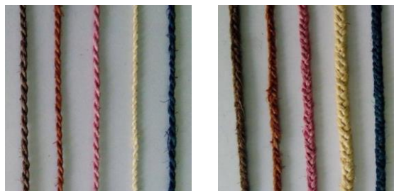
ภาพที่ 3 เส้นใยกล้วยเข้าเกลียว (ก) และเส้นใยกล้วย ถักเปีย (ข)

ตัวอย่างผลิตภัณฑ์ที่ทำจากเส้นเกลียวและเปีย โดยใช้เทคนิคการสาน การบิดไขว้ และการมัดปม ดังภาพที่ 4